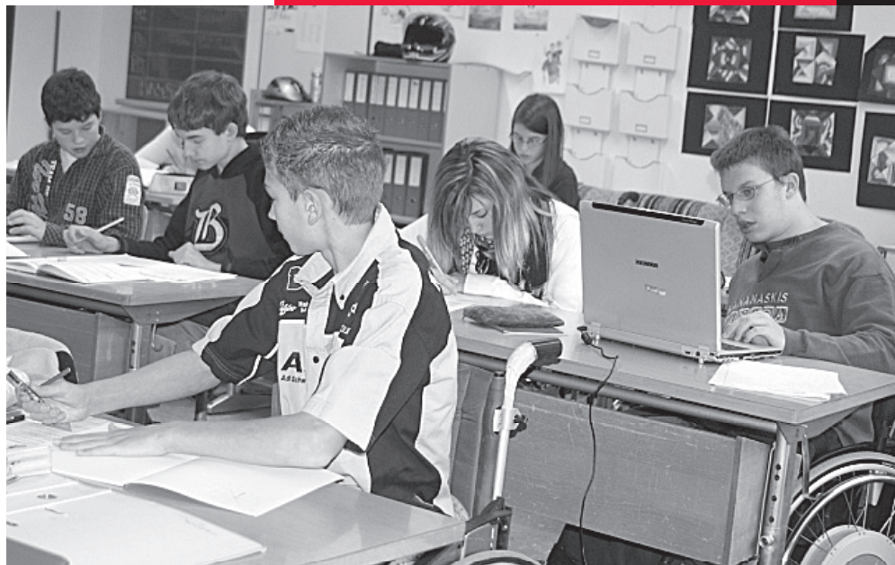
Auf dem Rollstuhl die «Schulbank drücken».

Als Folge der Integrationswoche konnten 2007 fünf Kinder und Jugendliche aus den zeka-Sonderschulen in Regelschulen übertreten. Für eine sinnvolle Integration ist eine permanente vertrauensbildende Überzeugungsarbeit bei allen Beteiligten notwendig. Lehrkräfte, aber auch Institutionen wie zeka, sehen sich häufig mit dem Vorwurf konfrontiert, durch ihrer Haltung für die Separation von Kindern und Jugendlichen mit besonderen Betreuungsbedürfnissen verantwortlich zu sein. Die Ergebnisse der Befragungen zeigen aber deutlich: