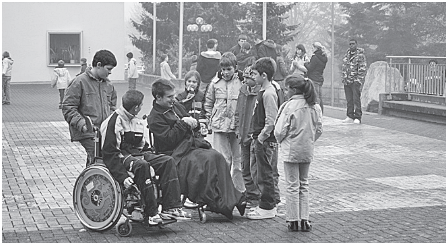
Anderssein bewirkt Neugier.

Die Stiftung Zentren Körperbehinderte Aargau zeka führte 2006 eine Integrationswoche durch, in der Sonderschülerinnen und -schüler eine Regelklasse besuchten. Aus der anschließenden Befragung von Kindern, Lehrpersonen und Eltern ergab sich einerseits Begeisterung, andererseits aber auch Skepsis für eine dauerhafte Integration.